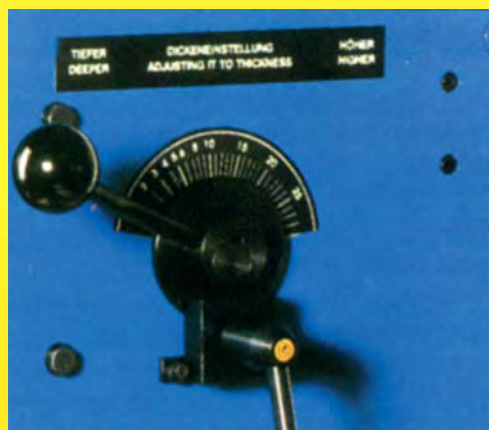
Un seul levier pour régler la hauteur des têtes.

Très silencieuse la KM 16 passe de l'agrafage à plat à l'agrafage à cheval en quelques secondes par simple basculement de la table de travail. Une touche coup par coup facilite les opérations de réglage.