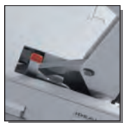
Dispositif de blocage de lame