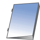
Agrafage à plat + pliage